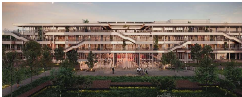
Agora des Transformations, EM Lyon, vue des Jardins

Lieu unique d'éducation et d'échanges au coeur de Lyon, le campus « Agora des Transformations » de l'EM Lyon Business School se déploie dans le quartier de Gerland, sur un site de 2,28 ha, connecté directement au réseau de transports collectifs de l'agglomération. Symbole de l'engagement Développement Durable de l'EM Lyon, l'opération est certifiée HQE Bâtiment Durable et labellisée R2S en conception.